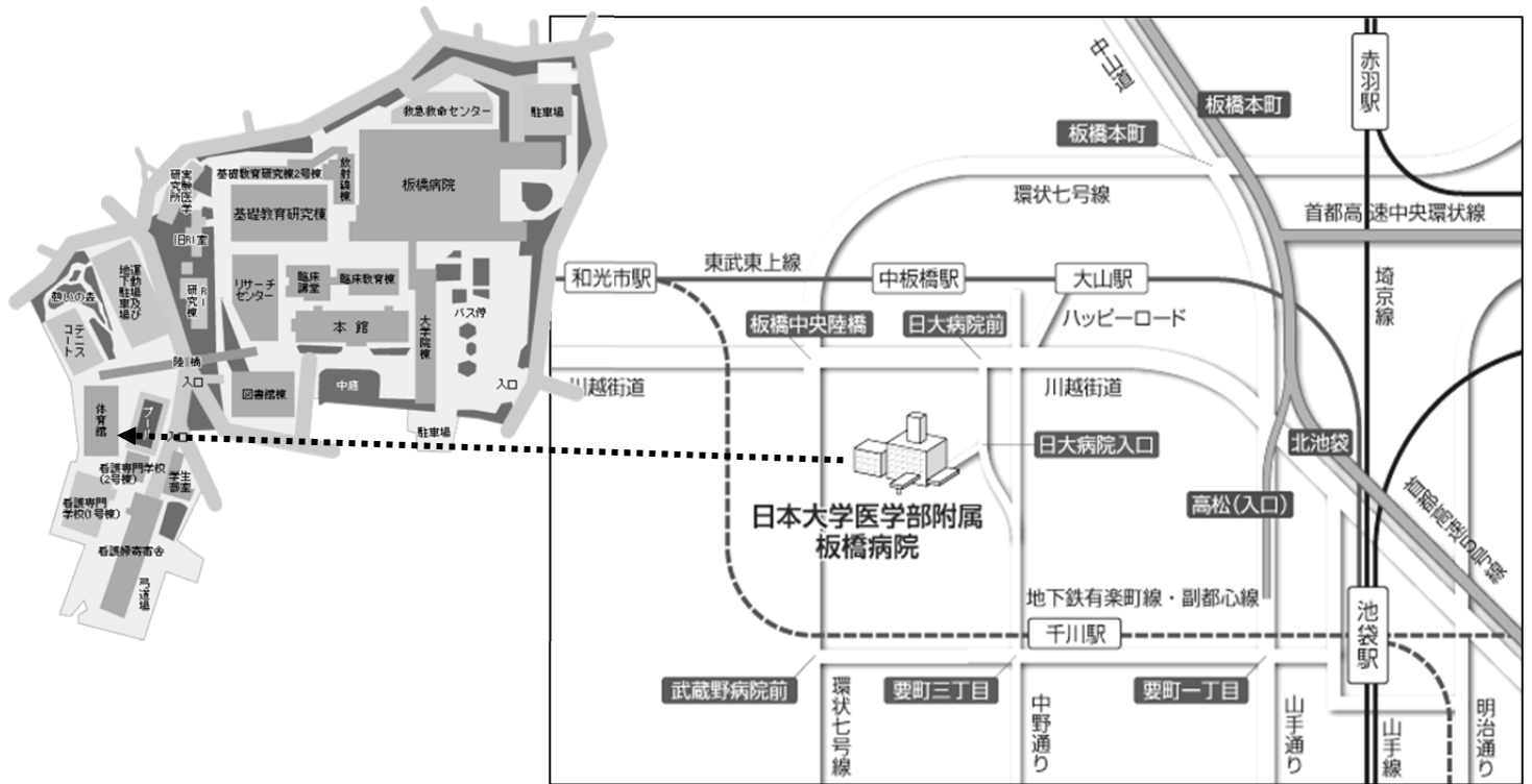
□ 地 図： 日本大学医学部体育館